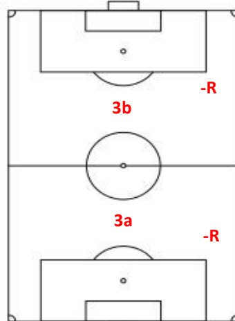
veld 3: natuurgras